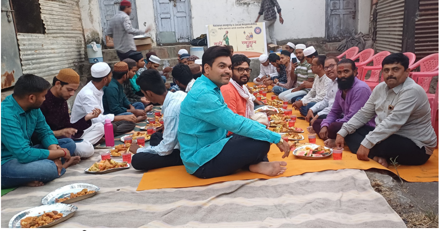
रमजान ईद इफ्तार पार्टी व गुढी पाडवा उपक्रम

सांस्कृतिक कार्यक्रम झाला. यामध्ये विद्यार्थ्यांनी नाटक, डान्स, गाणे समुहगीत, समूह डान्स असे वेगवेगळे प्रकारचे सांस्कृतिक कार्यक्रम सादर केले. तसेच यावर्षी क्लास ऑफ द इयर २०२५ ची टॉपकी डी फार्मसी मध्ये द्वितीय वर्ष डी फार्मसी व बी फार्मसी मध्ये तृतीय वर्ष बी फार्मसी या क्लासने टॉपकी जिंकली. या सर्व कार्यक्रमाचे आयोजन कॉलेजमधील सर्व प्राध्यापक व इतर सहकर्मचारी यांनी केले होते व नियोजनबद्ध हा सर्व कार्यक्रम पार पाडला. या