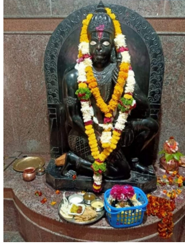
धर्मातील लोकांना सोबत घेऊन जाणारा हा