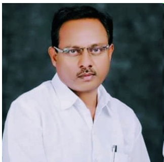
(बाँड पेपरचा)आग्रह धरू नये अशा स्पष्ट सूचना देण्यात आल्या आहेत.त्यानुसार महाराष्ट्र शासन नोंदणी विभाग व मुद्रांक विभाग ३० ऑक्टोबर