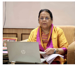
जनजागृती करण्यात यावी, अशा सूचना विधान परिषदेच्या उपसभापती डॉ. नीलम गोन्हे यांनी आज दिल्या. उपसभापती डॉ. गोन्हे यांनी मुंबई, ठाणे, नाशिक, जळगांव, धुळे पुणे, छत्रपती संभाजीनगर महानगर पालिका

मुंबई |प्रतिनिधी नायलॉन मांजामुळे राज्यात काही भागात नागरिक जखमी झाल्याच्या घटना घडल्या आहेत. काही प्रकरणात, तर जीवितहानी झालेली आहे. अशा घटना टाळण्यासाठी नायलॉन मांजाच्या उत्पादनावर बंदी आणत राज्यात ज्या ठिकाणांवर तसेच ऑनलाइन मांजा विक्री केली जात आहे, अशा ठिकाणी सक्त कारवाई करण्यात यावी. मांजाच्या उपयोग टाळण्यासाठी