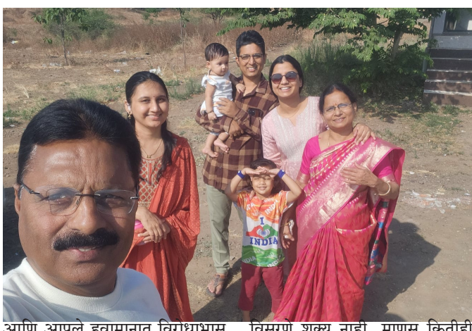
आणि आपले हवामानात विरोधाभास असला तरी श्रध्दाला पर्याय न ठेवता अगदी आनवानी पायांनी मंदिरापर्यंत गेली अगदी साष्टांग दंडवत देखील घातला. मी अमेरिकेत गेली असली तरी माझ्या मायभुमिची संस्कृती ही कदापी