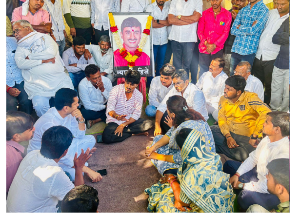
प्रकरणाची निष्पक्षपाती चौकशी होणे गरजेचे आहे. तसेच, मागील काही दिवसांपासून बीड मतदारसंघात पवनचक्की कंपन्यांच्या अधिकारी, कर्मचाऱ्यांकडून शेतकऱ्यांची पिळवणूक केली जात आहे, यात स्थानिक आमदारांचे आर्थिक हितसंबंध देखील आहेत. त्यांच्या