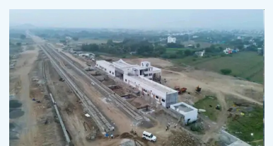
असून जानेवारी २०२५ च्या शेवटच्या आठवड्यात या मार्गावरील सुरक्षेची चाचणी घेण्यात येणार आहे. या रेल्वे मार्गावरील ५०० मीटर लांबीचे

बीड / प्रतिनिधी नगर-बीड परळी रेल्वेमार्गाची अंमळनेर ते विघनवाडी अशी ३३.१२ किलोमीटरची चाचणी १ ऑगस्ट २०२४ रोजी पूर्ण झाल्यानंतर आता शिरूर तालुक्यातील विघनवाडी ते बीड अशा ३५ किलोमीटर अंतरापैकी २२ किमीचे नवगण राजुरी गावापर्यंत रेल्वेचे रूळ अंधारण्याचे काम पूर्ण झाले आहे. डिसेंबर २०२४ अखेर रेल्वेची चाचणी होणार आहे. पुढच्या टप्प्यातील नवगण राजुरी ते बीड अशा १३ किलोमीटर अंतरात रेल्वेचे रूळ अंधारण्याचे काम सध्या प्रगतिपाथवर