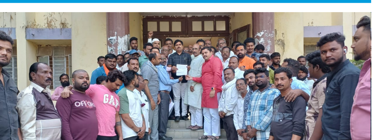
करण्यात आली या घटनेचा निषेध नोंदवण्यात आला आहे. दरम्यान याच बैठकीत परभणी येथील संविधान विटंबनेच्या निषेधार्थ शुक्रवारी परळी बंदची हाक देण्यात आली असून या घटनेतील आरोपीला का कडक शासन करण्यासाठी जलद

परळी / प्रतिनिधी परभणी येथील भारतरत्न डॉ बाबासाहेब आंबेडकर यांच्या पुतळ्या जवळ भारतीय संविधान पुस्तेकीची प्रतिकृती साकारण्यात आली होती या संविधान पुस्तेकीची एका नाराधमा कडून विटंबना करण्यात आली यामुळे आम्हां भारतीयोंच्या भावना दुखावल्या असून या नाराधमाला कडक शासन करण्यासाठी परळीतील सर्व पक्षीय, व्यापारी महासंघ व आंबेडकर अनुयायांच्या वतीने शुक्रवार दि. १३ डिसेंबर रोजी परळी शहर बंदचे आवाहन करण्यात आले आहे. आज बुधवार दि. ११ डिसेंबर रोजी परळीतील सर्व पक्षीय, व्यापारी महासंघ व आंबेडकर अनुयायांच्या वतीने नेते, पदाधिकारी कार्यकर्ते यांचे व्यापक बैठक घेण्यात आली या बैठकीत परभणी येथील भारतरत्न डॉ बाबासाहेब आंबेडकर यांच्या पुतळ्या जवळ भारतीय संविधान पुस्तेकीची प्रतिकृती साकारण्यात आली होती या संविधान पुस्तेकीची एका नाराधमा कडून विटंबना