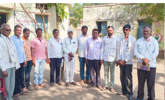
पाणीपुरवठा जलकुंभ डागडुजी करणे, शाळेतील संरक्षण भिंत, क्रिडा साहित्य उपलब्धता, परिपाठासाठी लाऊड स्पिकर, परिपाठ मैदानात प्लेवर्ल्साक बसवणे, शालेय पोषण आहार किचन दुरुस्ती, विद्यार्थ्यांना शुद्ध पाणी, प्रयोगशाळेसाठी स्वतंत्र कक्ष मागणी करणे, संगणक मागणी व कक्ष उभारणे, परसबाग तयार करणे. अशा विविध भौतिक सुविधा करण्याचे नियोजन करण्यात आले. यासाठी राज्यशासनाच्या राजमाता जिजाऊ वार्धांधनी योजना, सह ग्रामपंचायत हिवरसिंगा, शासनाच्या विविध योजना