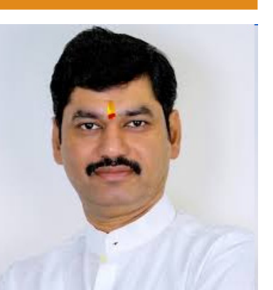
सोयाबीनचा प्रश्न निर्माण झाला होता. त्यामुळे या मर्यादेत वाढ करून शेतकऱ्यांच्या उत्पादनाच्या प्रमाणात सोयाबीन खरेदी केली जावी, अशी मागणी धनंजय मुंडे यांनी लावून धरली होती. अखेर मुंडेंच्या या मागणीस यश आले असून आता बीड जिल्ह्यात अधिकृत केंद्रांच्या माध्यमातून नोंदणी केलेल्या शेतकऱ्यांची प्रति हेक्टर १.५० किटल ऐवजी २.९.५१ किटल पर्यंतची सोयाबीन शेतकऱ्यांना हमीभावाने विकता येणार आहे. ,

मुंबई - बीड जिल्ह्यातील सोयाबीन उत्पादक शेतकऱ्यांसाठी आनंदाची बातमी असून, धनंजय मुंडे यांच्या मागणीला यश आले आहे. बीड व लातूर जिल्ह्यात सोयाबीन खरेदी करण्यासाठी हमी भाव खरेदी केंद्रांना प्रति हेक्टर उत्पादकतेची जी मर्यादा देण्यात आली होती, त्यात दुप्पटीपेक्षा अधिक वाढ करण्यात आली आहे.